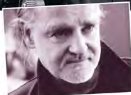
Filme de Walter Carvalho traz depoimentos de realizadores de cinema como o cineasta Béla Tarr

Na tela, os diretores – alguns dos mais brilhantes em atividade – falam sobre suas angústias, crenças e formas de filmar a partir de provocações que Walter Carvalho